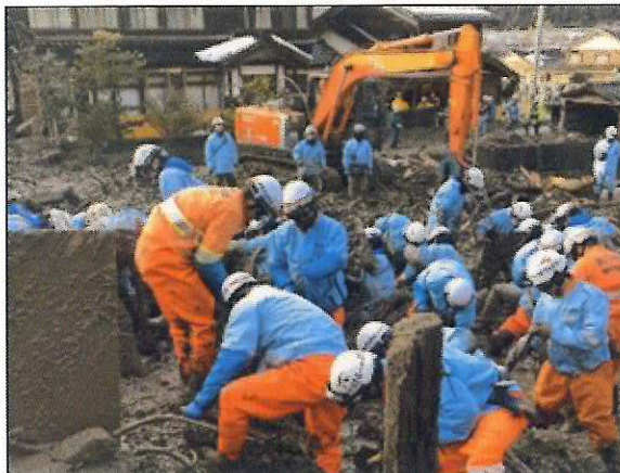
▲輪島市市ノ瀬町での捜索活動

二十枚の写真とキャプションで知る 能登半島地震の消防・救助・救急活動記録 ▼令和六年一月十五日から二月二十一日までの延べ三十八日間、二十五隊百名規模の活動記録