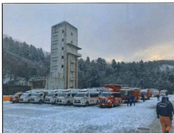
▲福井県消防学校に集結した兵庫県大隊のようす