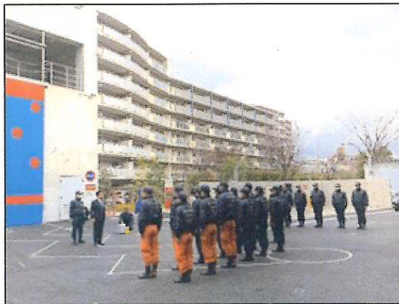
▲第1次派遣隊西宮市出発式