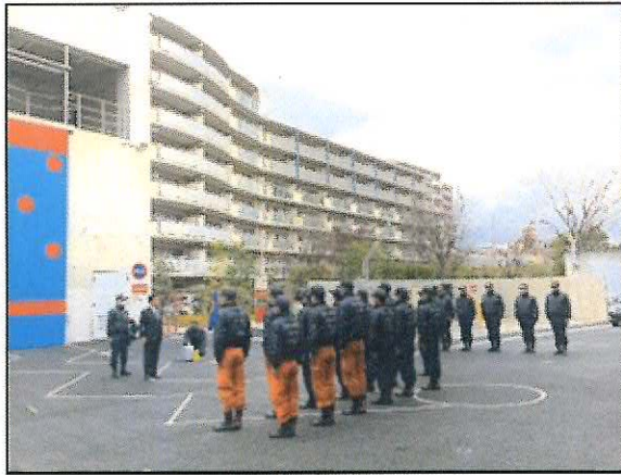
▲第1次派遣隊西宮市出発式

二十枚の写真とキャプションで知る 能登半島地震の消防・救助・救急活動 ▼令和六年一月十五日から二月二十一日までの延べ三十八日間、二十五隊百名規模の活動記録