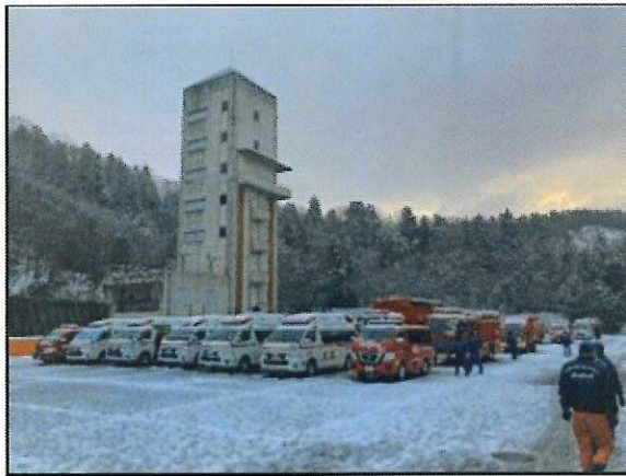
▲福井県消防学校に集結した兵庫県大隊のようす