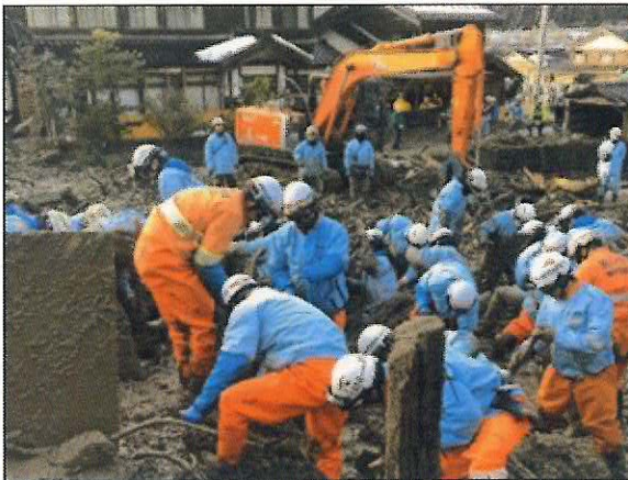
▲輪島市ノ瀬町での捜索活動