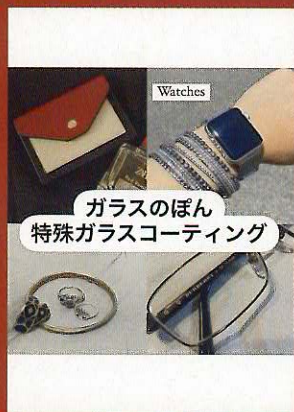
スマホのコーティング 『ガラスのぼん』