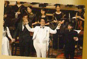
レ・ミゼラブル in 西宮 兵庫県立芸術文化センターでの公演