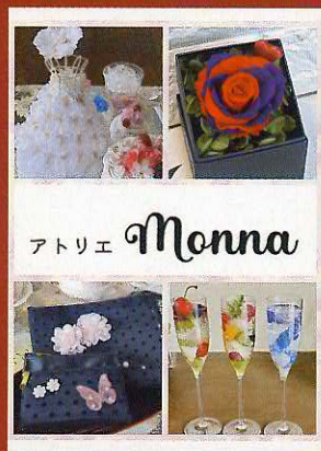
フラワーショップ 『アトリエMonna』