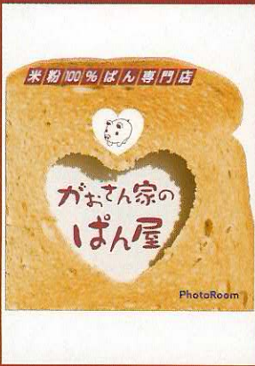
米粉100%ぱん専門店 『がまん家のぱん屋』