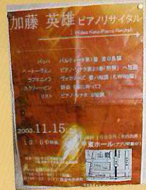
初リサイタルの 公演フライヤー