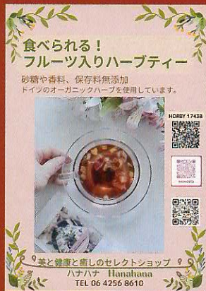
食べられるハーブティー 『ハナハナ』