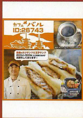
名物カツサンド 『カフェパル』