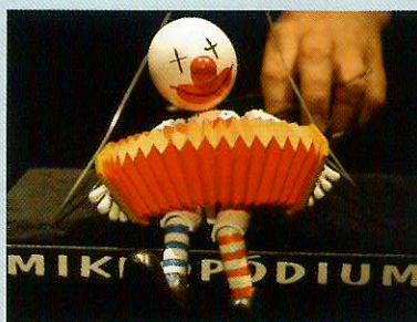
マイクロポディウム「Stop!」