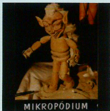
マイクロポディウム 「CON ANIMA(心をこめて)」

《2回目》中学生以上のおとなが楽しむ人形劇 です。通訳付き。アフタートークもお楽しみに！