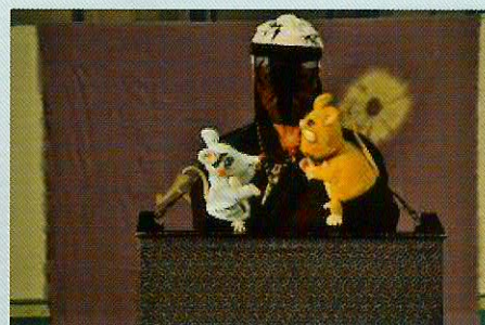
人形芝居 燕屋 「肩掛け人形芝居 ねずみのすもう」