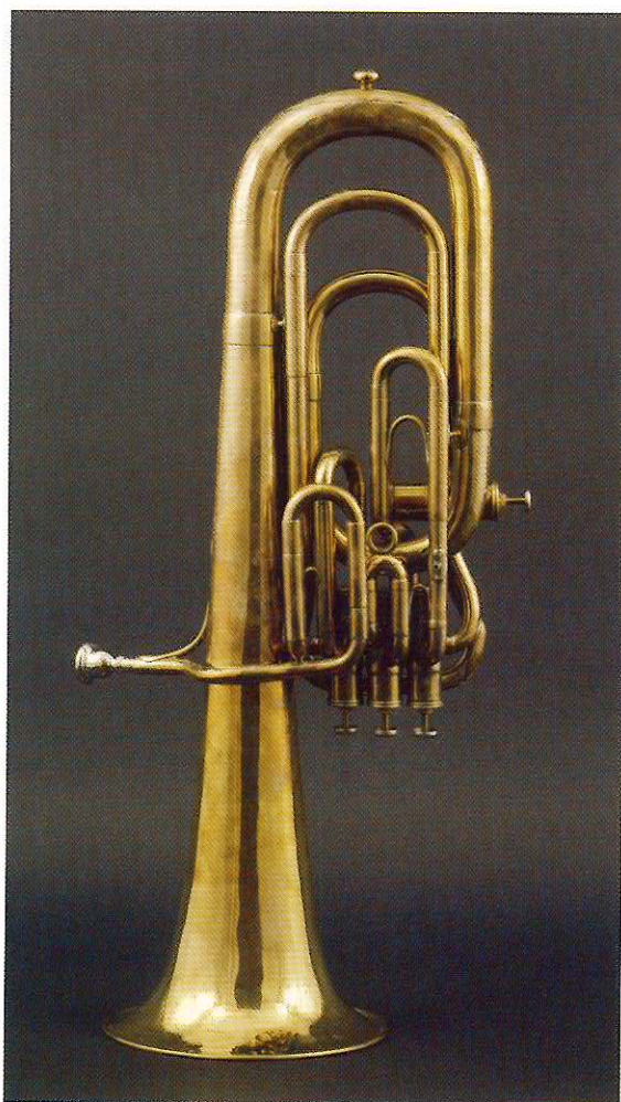
アドルフ・サククス (Adolphe Sax) 製 サクソルンバス 1866年製 パリ