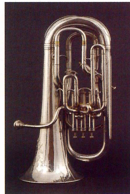
ブージー (Boosey & Co.) 製 ユーフォニオン 1897年製 ロンドン